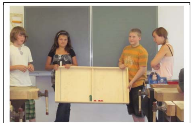
Es wurde kurz bewertet wie die Zusammenarbeit und die Herstellung funktionierten.