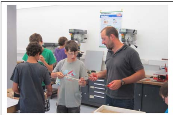
und bei Bedarf den Expertenrat einzuholen.