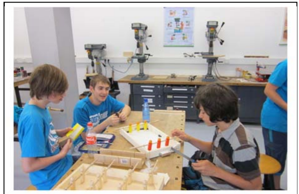
Unser Ziel war es Qualität herzustellen!