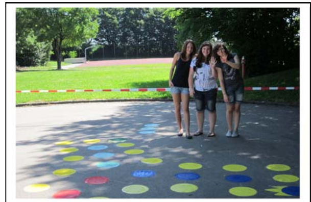
Teamwork war angesagt