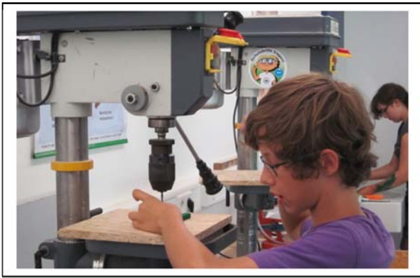
Es galt Arbeitsschritte aufzuteilen,