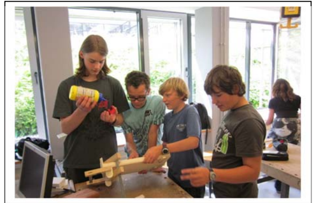
gemeinsam zu planen und zu überlegen