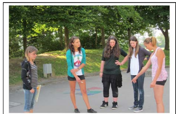
Kreativität und problemlösendes Denken waren gefragt!