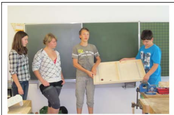
Nach Beendigung der Arbeit wurde das Produkt den anderen Gruppen vorgestellt.